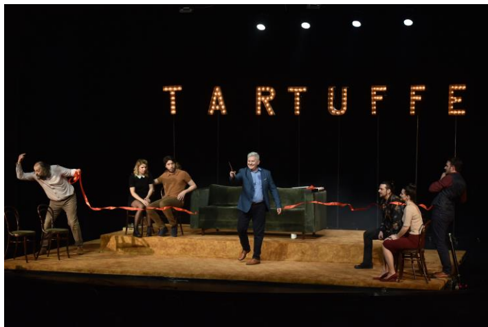
Тартиф - награда „Мија Алексић” за најбољу представу